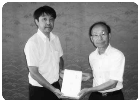
京セラ労働組合野洲支部 様