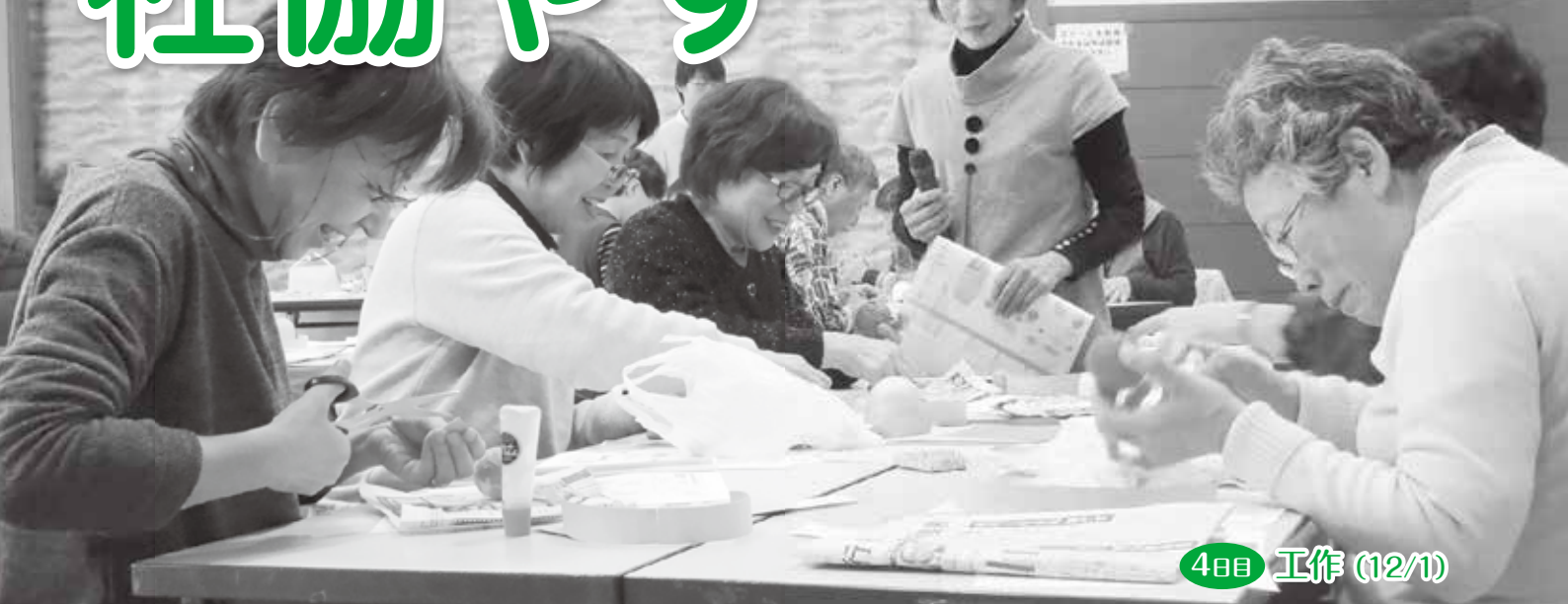
4日目 工作 (12/1)