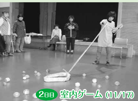
2日目 室内ゲーム (11/17)

老後をいきいき暮らすには「人と会って会話をし、大声で笑うこと」「出かけて行って仲間と楽しい時間を過ごすこと」「定期的に外出する機会があること」こんなことが日常生活の中に組み込まれていることが大切です。