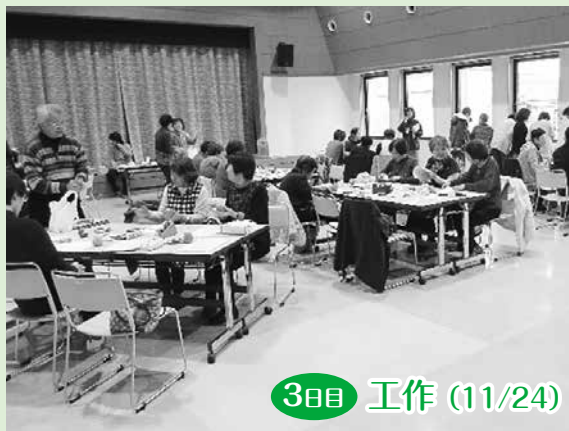
3日目 工作 (11/24)