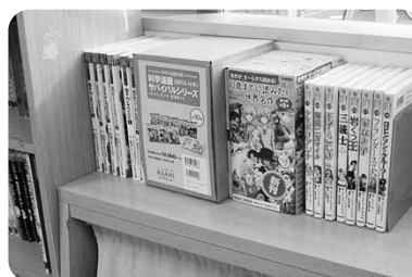
世界名作シリーズ 34巻セット