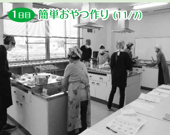
1日目 簡単おやつ作り (11/7)