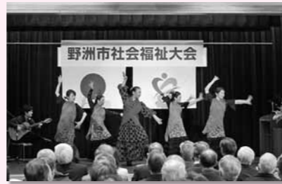
「ラス・フローレス」のフラメンコ