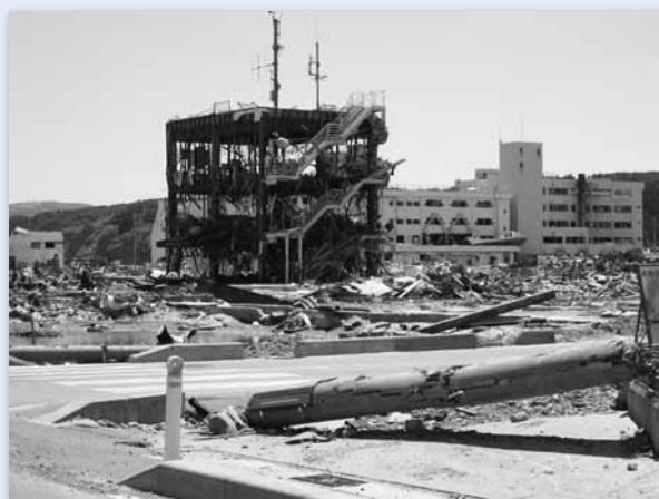
津波の被害を受けた南三陸町