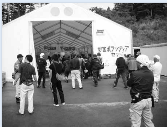
南三陸町災害ボランティアセンター